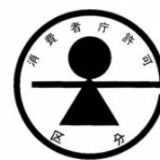
543 (b) 特別用途食品の標識

544 以上に述べた(a) 保健機能食品、(a) ① 特定保健用食品、(a) ② 栄養機能食品、(a) ③ 機能 545 性表示食品、(b) 特別用途食品（特定保健用食品を除く。）の規制上の関係を図示すると次表 のとおりとなる。