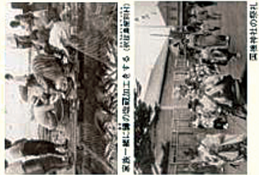
葉附村の漁師が魚を加工する様子