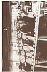
歯舞群島 北沢島のかんづり工場