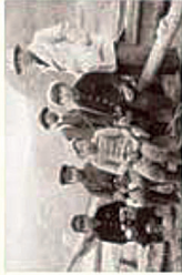
色丹島色丹村少年の少年たち

第二次世界大戦が終わるまで北方領土の4つの島には、1万7,291人の人々が住んでおりました。この中には、みなさんと同じ小学生もたくさんおり、小学校が39もありました。