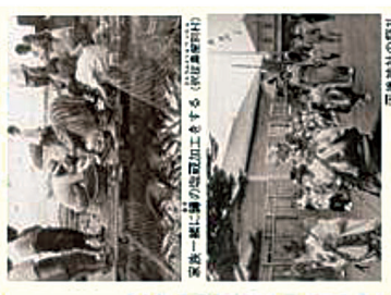
葉附村の漁師が魚を加工する様子(佐藤真由希)

北海道にはいろいろな動物がいます。北海道にはいろいろな動物がいます。北海道にはいろいろな動物がいます。