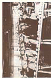
歯舞群島北見島のかんづり工場