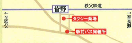
皆野駅周辺案内図