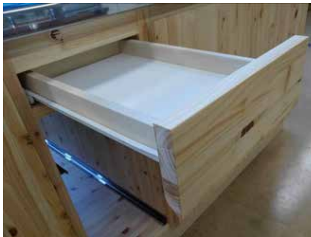
シンク蓋ガス蓋収納用レール