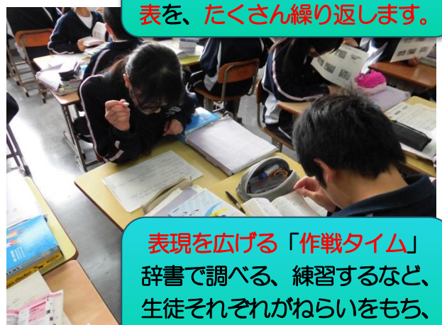
表現を広げる「作戦タイム」 辞書で調べる、練習するなど、生徒それぞれがねらいをもち、主体的に活動