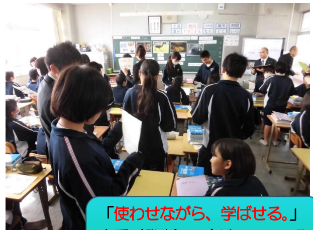
「使わせながら、学ばせる。」 本番(発表)へ向けて、ミニ発表を、たくさん繰り返します。