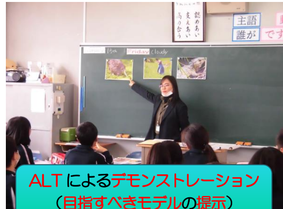
ALTによるデモンストレーション (目指すべきモデルの提示)