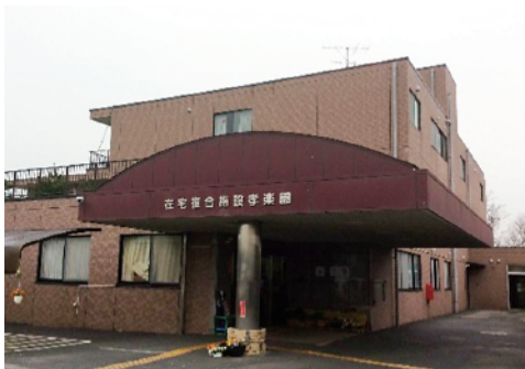
在宅複合施設「孝楽園」