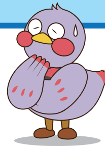
埼玉県マスコット 「さいたまっち」