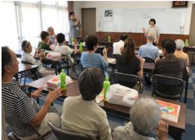
○ 食事会と併せて認知症講座を開催

カフェを開催してから、団地内を散歩する高齢者と児童が気軽に挨拶をする姿が、多く見受けられるようになってきました。