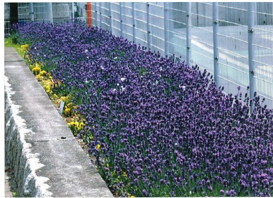
○ 満開となったラベンダー