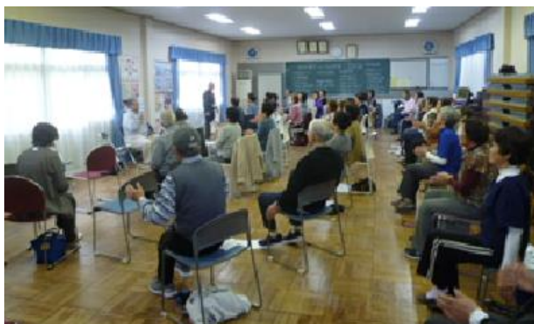
○ 集会室で「いきいき100歳体操」を実施

運動教室では、外部から指導員を招いたり、入居者が資格を取って講師となったりし、体力測定も行って高齢者の体力向上を確認しています。