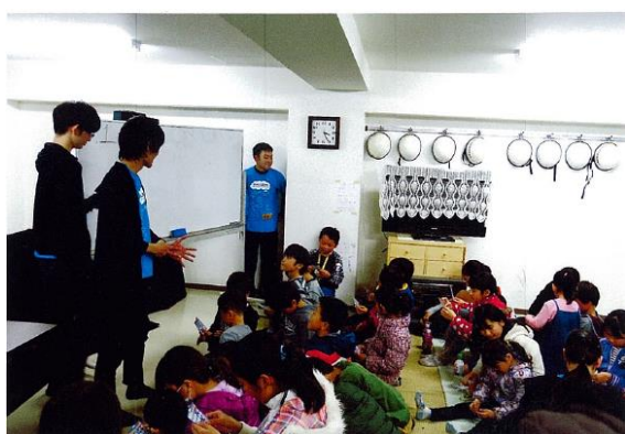
○ 大学生による人形劇