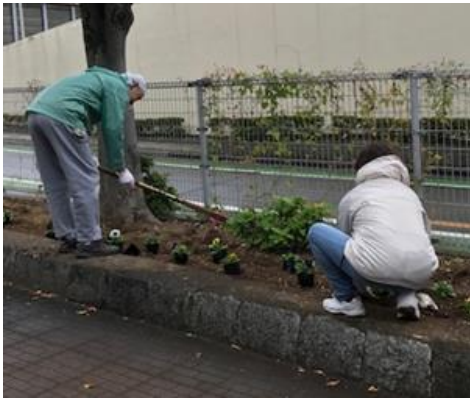
○ 入居者による花壇の手入れ

また、ラベンダーの花でポプリを作り、入居者の皆さんにお配りして、喜んでいただける活動となっています。