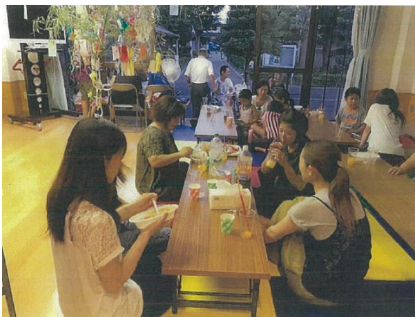
○ セタの夜に開催した食事会