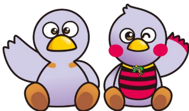
コバトン・さいたまっち