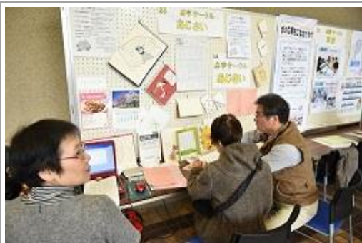
団体の説明を受けている様子