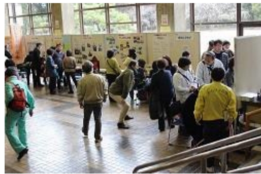
各団体のブースが並ぶ