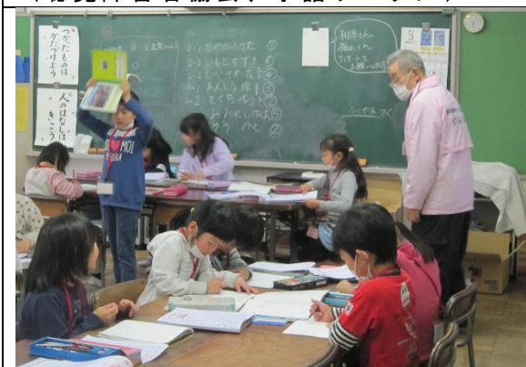
放課後子ども教室 （中央東小学校放課後子ども教室）