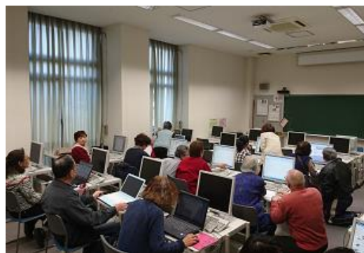
パソコンなんでも相談室 （パソコン支援隊）