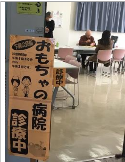
おもちゃの修理を行います（おもちゃの病院）