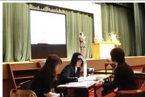
手話通訳と要約筆記も導入