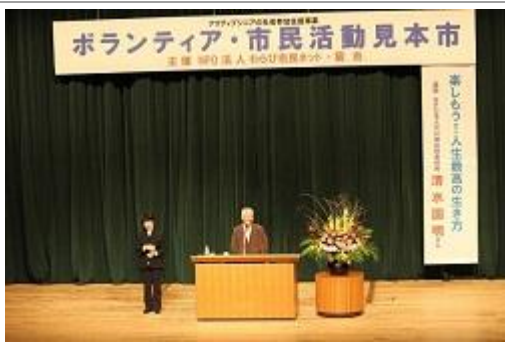
『楽しもう！ 人生最高の生き方！』 と題した講演会