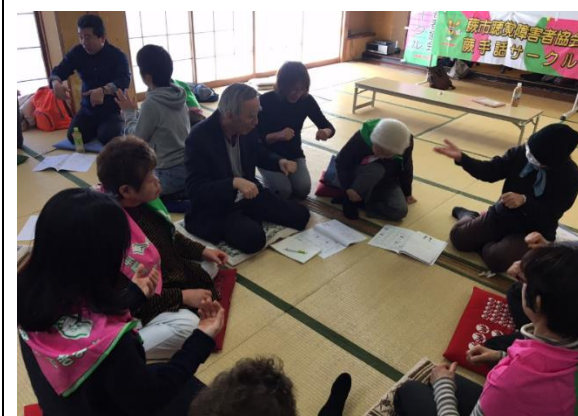
手話の体験会 （聴覚障害者協会、手話サークル）