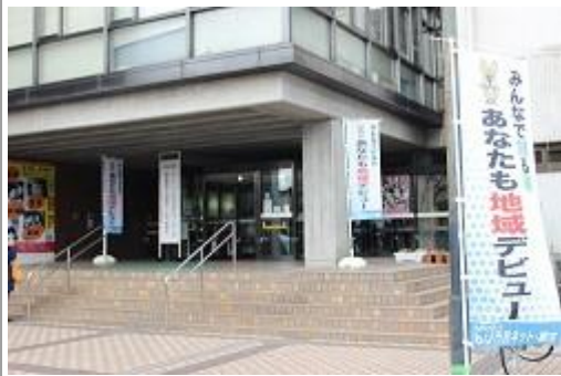
ボランティア・市民活動見本市平成 29 年 2 月 5 日(日)開催