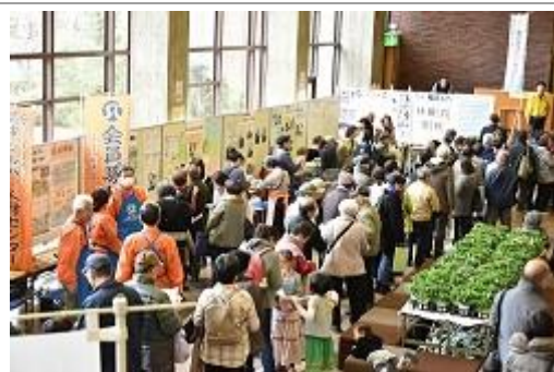
講演会前には行列が！