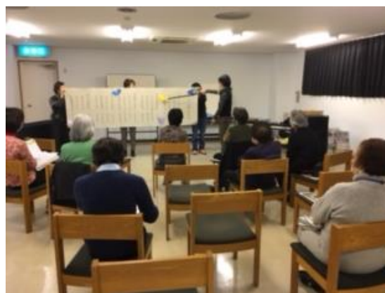
（語りの会 蕨てんとう虫の会）