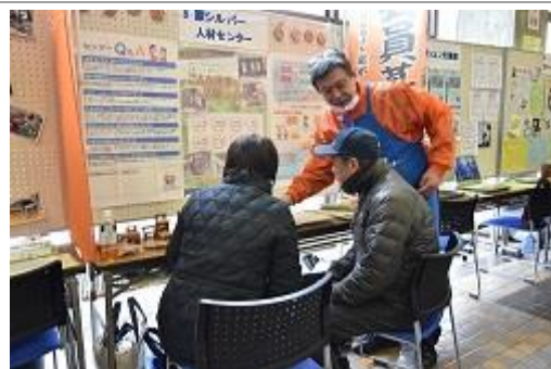
団体から説明を受けている様子