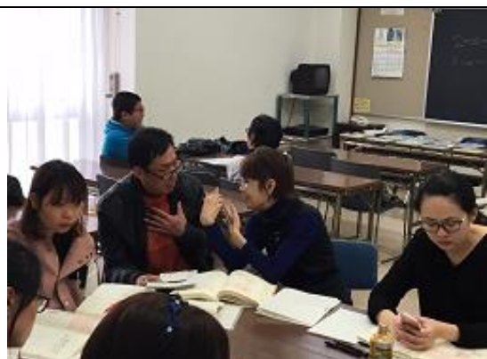
日本語教室 （日本語ボランティアわらび中央）