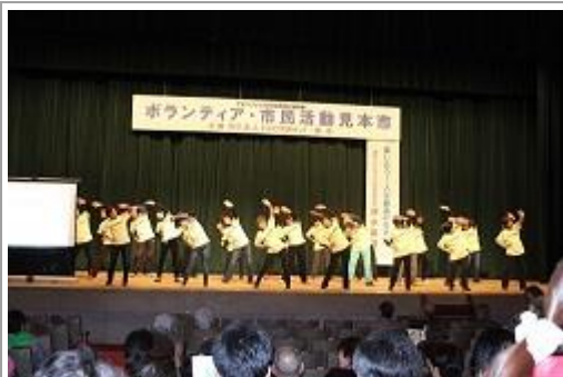
健康体操のデモンストレーション