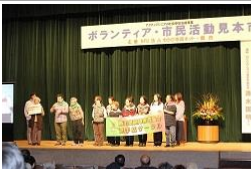
各団体が舞台に並び活動をPR