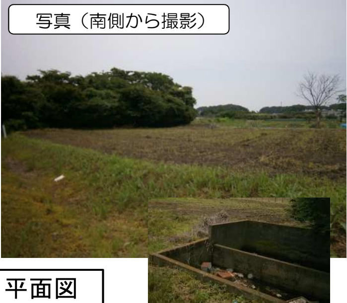
写真（南側から撮影）

【概要】 所 在：さいたま市緑区三浦93 現 況：畑 面 積：657.55㎡ 接 道：北側幅員4m程度（舗装） 南側幅員3m程度（未舗装） その他：見沼代用水土地改良区賦課金を負担していただきます。 （令和5年度：3.98円/㎡）