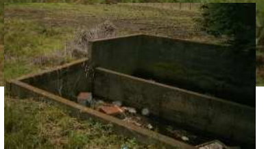
北西端に写真の構造物があります。