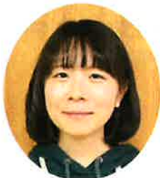
学習ボランティア (学生・社会人)