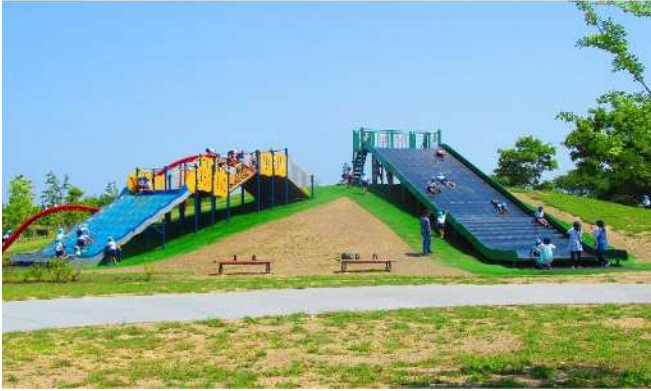
【大型遊具】 2号公園の大型遊具。 カーボンライダーやプレイウォールなど大人気です。