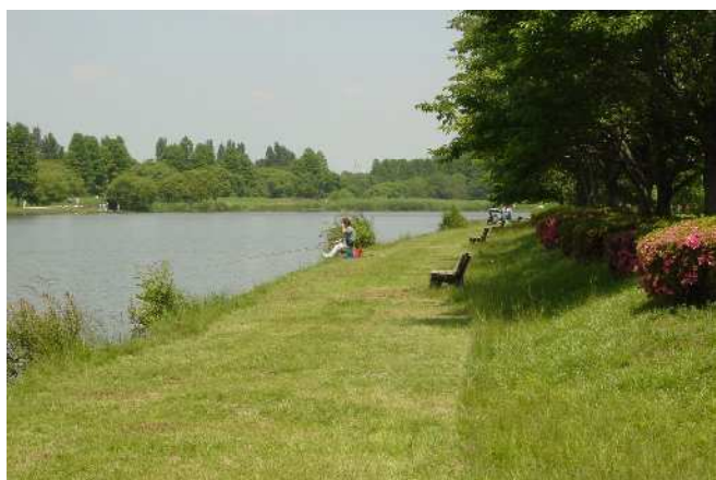
【小合溜井】江戸川と中川の間に小合溜井があります。これは、18世紀前半の享保年間に造られた遊水地（川の水が増水したときに一時的に水をためて水位を調整する機能をもった池）で、当時は江戸の町を洪水から守り、水田を潤すなど重要な役割を持っていました。