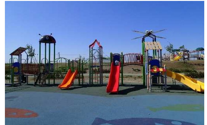
【小型遊具 (にぎわいの水辺)】