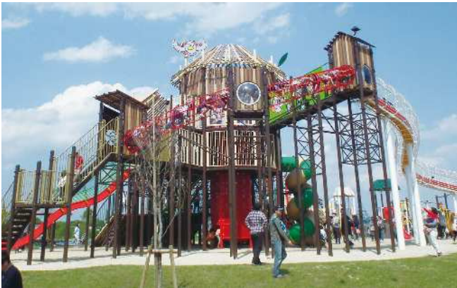
【大型複合遊具 (コバトンアドベンチャー)】