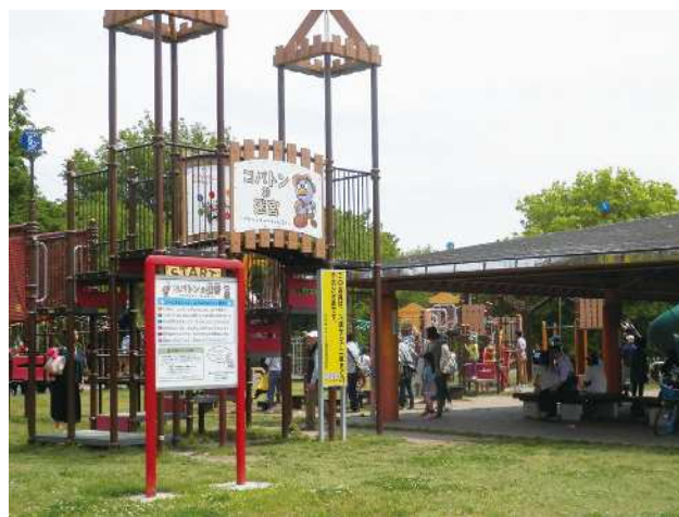
【コバトンの迷宮】平成25年に遊具を一新しました。毎日子供たちの楽しい声が響きます。