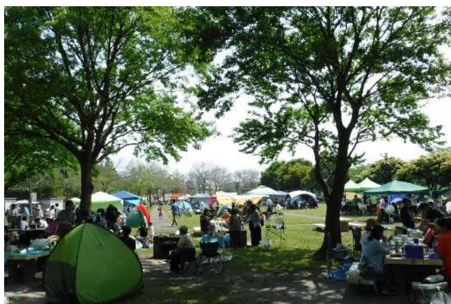
【バーベキュー広場】炊事場68区画（内カマド20基）があります。