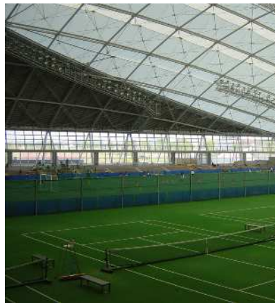
【彩の国くまがやドーム(多目的運動場)】