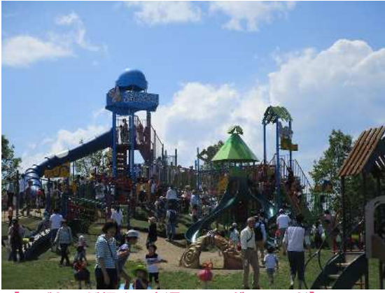
【コバトンが行く！水辺のワンダーランド】 水辺の生き物がモチーフとなった大型遊具です。幼児向け遊具も併設しています。