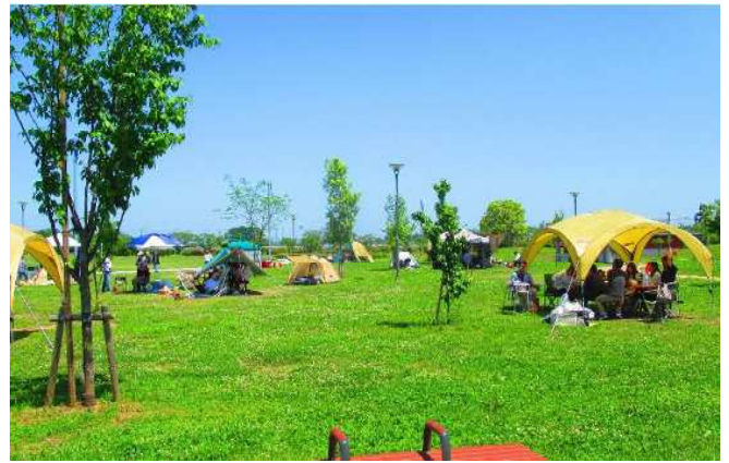
【2号公園】権現堂調節池の水辺空間を活かした「緑に囲まれた水辺のレクリエーション拠点」がテーマの公園。デイキャンプ場や大型遊具が楽しめます。