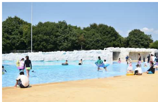
【さざなみプール】全長200mのなぎさは日本最大規模です。