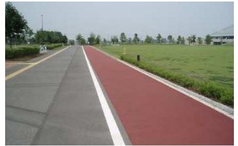
【ジョギングコース】約4.4kmのジョギングコースは、ソフトな路面になっていて人気があります。