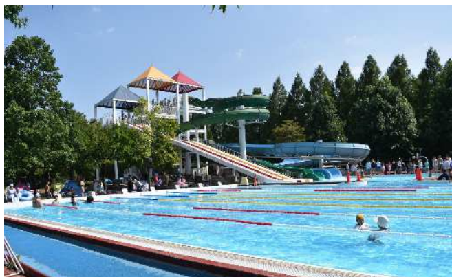
【スライダープール・多目的プール】直線と曲線の2種があります。水色のスライダーは浮き輪に乗って滑るタイプ。多目的プールは本格的に泳ぐこともできます。

■所在地 加須市船越、下高柳、水深地内 ■問合せ 加須はなさき公園管理事務所 TEL 0480-65-7155