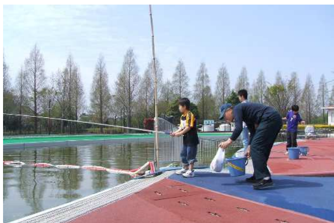
【プールフィッシング】夏季プール以外の期間、釣り場を開園しています。