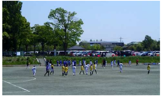
【多目的グラウンド】