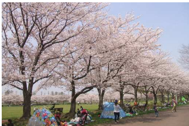
【桜】ソメイヨシノを始めとした約400本の桜が咲きます。

■都市計画決定面積 41.1ha ■開設面積 16.9ha ■所在地 三郷市高洲三丁目地内 ■問合せ みさと公園管理事務所 TEL 048-955-2067