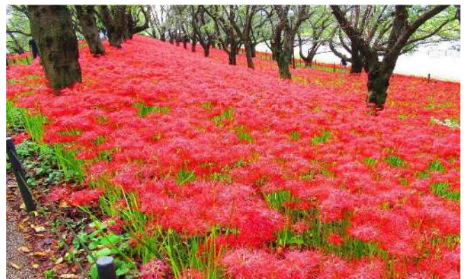
【マンジュシャゲ】約300万本、赤を中心に白・ピンク・黄色の花を咲かせます。