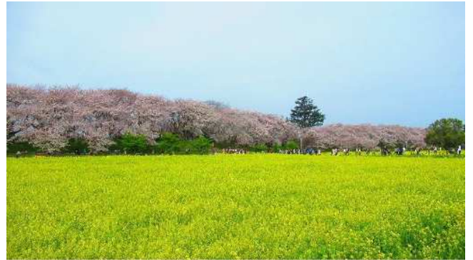
【4号公園】権現堂桜堤に春は桜と菜の花、初夏のアジサイ、夏のヒマワリ、秋のマンジュシャゲと四季折々の花が楽しめます。