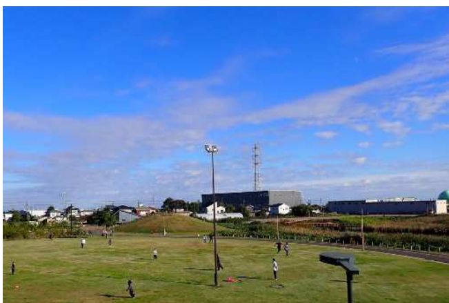
【北園芝生広場・多目的広場】