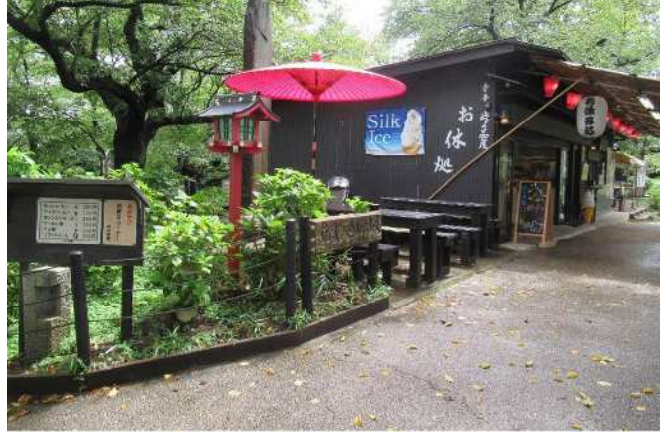
【峠の茶屋】 4号公園（権現堂桜堤）のシンボル「峠の茶屋」。