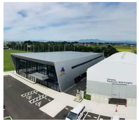
【さくらオーバルフォート】