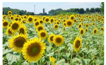
【水辺の花畑エリア】