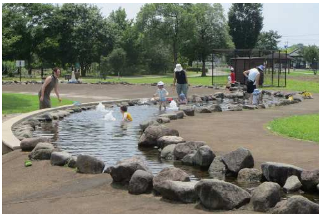
【じゃぶじゃぶ流れ】