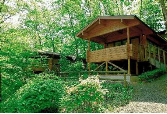
テニスコート、コテージ、F1カート、フォレストアドベンチャーなどがあります。