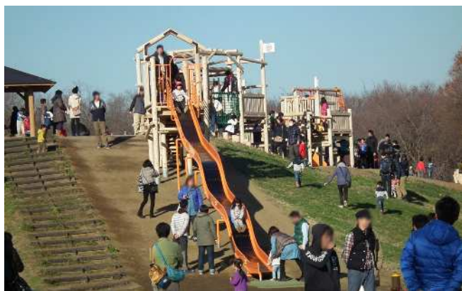
【わくわくチャレンジ冒険トリデ (木製遊具)】