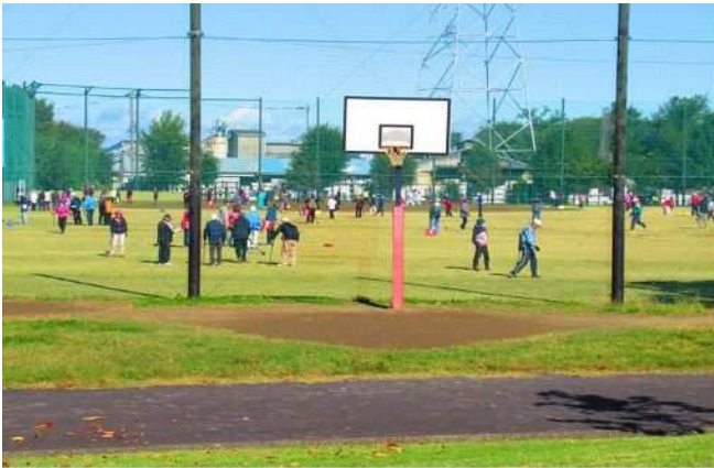
【1号公園】多目的運動広場、球技広場や遊具広場を持つスポーツレクリエーションの拠点施設。

■問合せ 権現堂公園管理事務所 1号公園 TEL 0480-53-1553 2号公園 TEL 0480-53-8787 4号公園 TEL 0480-44-0873