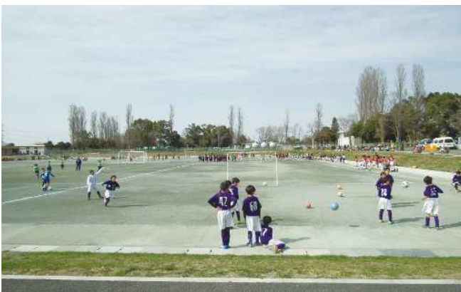
【多目的グラウンド】