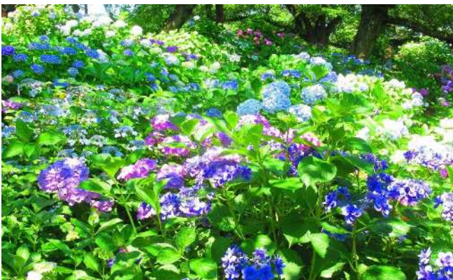
【あじさい】およそ100種、10,000株のあじさいが見られます。