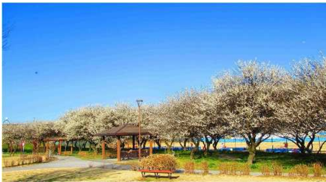
【3号公園】歴史と文化の薫る「万葉」をテーマにした花と緑の公園です。