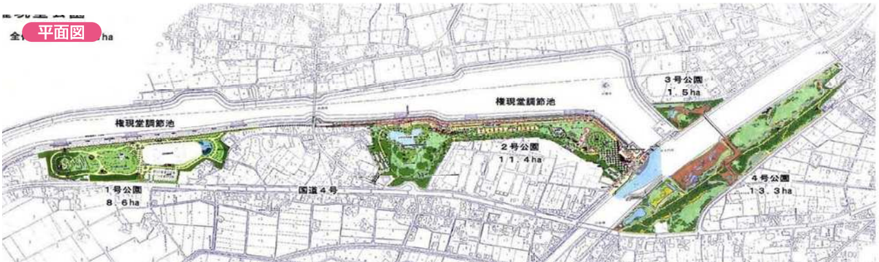
全 平面図 ha