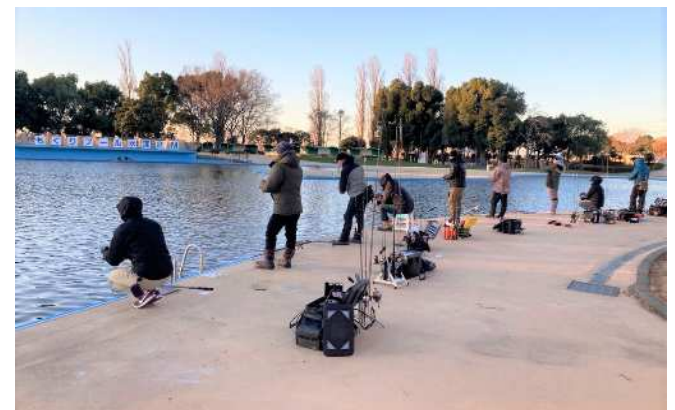
【プールフィッシング】