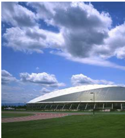
【彩の国くまがやドーム】