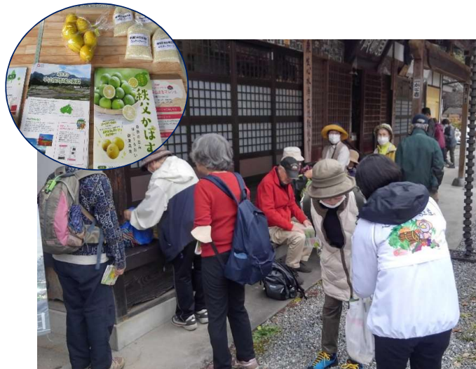
11/20 横瀬町 (札所6番ト雲寺) (横瀬町ウォーキングイベント)

西武鉄道や横瀬町観光協会と連携し、横瀬町でのハイキングイベントやあしがくぼ氷柱イベントにおいて、寺坂棚田で生産された棚田米や棚田めぐりガイドを配布し、都市住民に向け情報発信を行った。