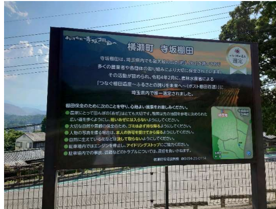
「つなぐ棚田遺産」認定の看板