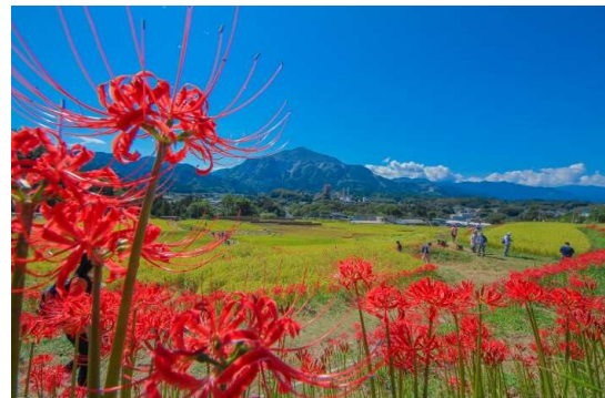
彼岸花まつり（9月中～下旬）