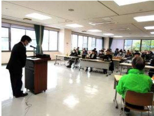
令和5年度寺坂棚田学校開校式の様子 ※寺坂棚田学校HP