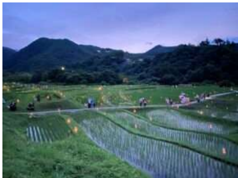
寺坂棚田ホテルかがり火まつり（7月上旬）