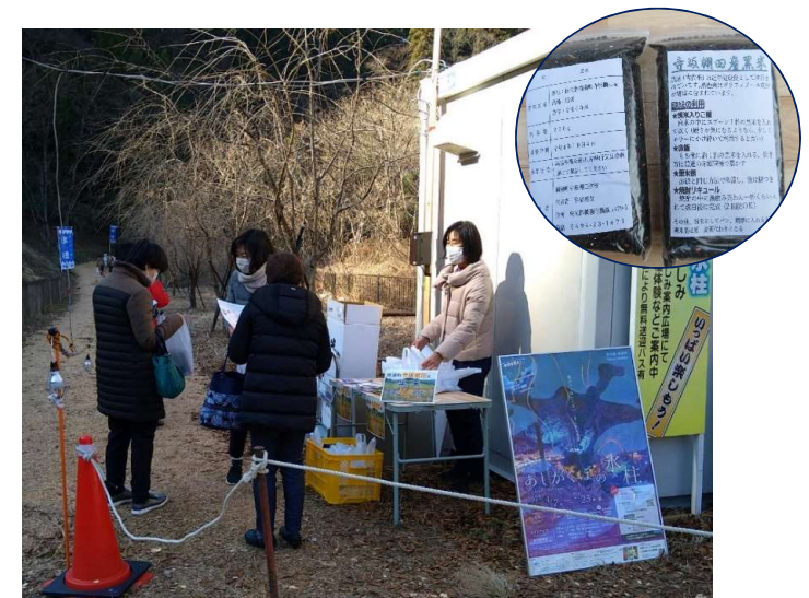
1/7横瀬町 (道の駅あしがくぼ) (あしがくぼ氷柱イベント)

イベントには、多くの観光客が訪れ、「寺坂棚田にも寄りたいたいと思う。」「棚田で作ったお米がもらえるなんて嬉しい」などの声が聞かれた。