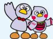
埼玉県のマスコット 「コバトン」「さいたまっち」

※ 交付決定後に対象となる取組を実施し、就業規則の作成又は改正を行う場合が対象となります。