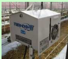
統合環境制御装置