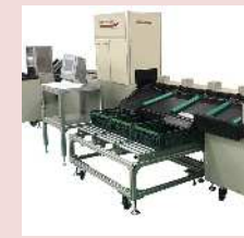
画像解析装置付選果機