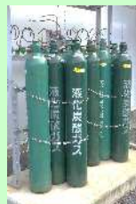
炭酸ガス施用装置