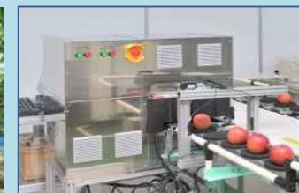
品質機能付き選果機