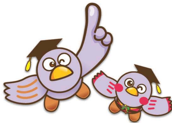
埼玉県マスコット 「コバトン」と「さいたまっち」