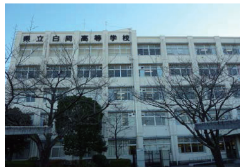
県立白岡高等学校

<施工年度> 平成 29 年 8 月 <施工場所> 白岡高等学校 <発注機関> 埼玉県