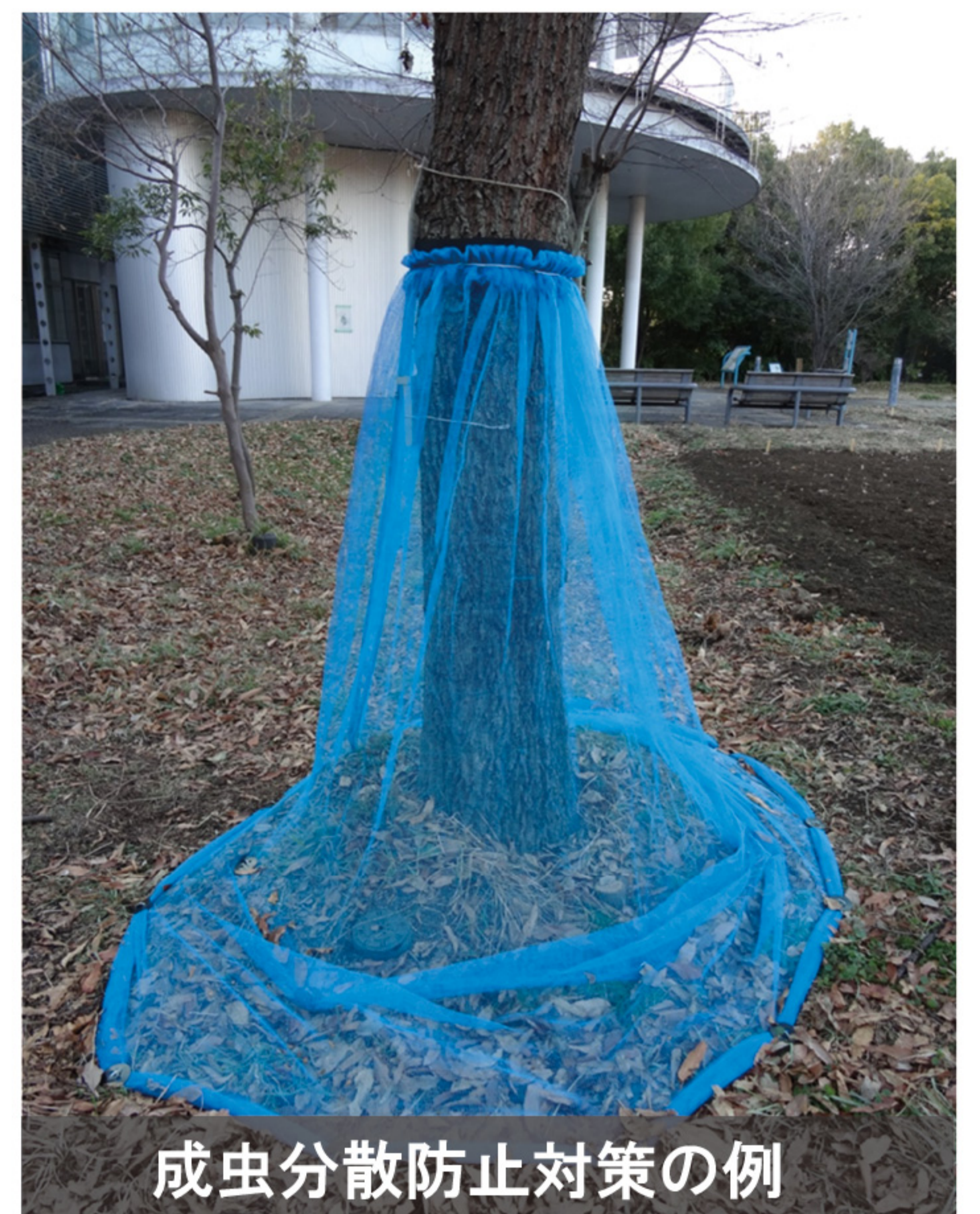
成虫分散防止対策の例