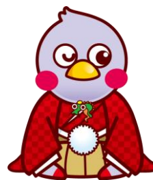
埼玉県マスコット さいたまっち

埼玉県文化振興基金は、皆様の寄附金で成り立っています。 文化振興基金の拡充に御支援、御協力を賜りますようお願いいたします。