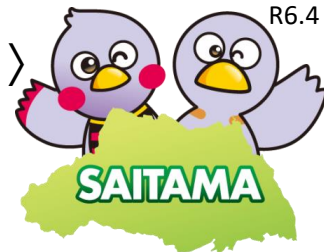
埼玉県マスコット「さいたまっち&コバトン」