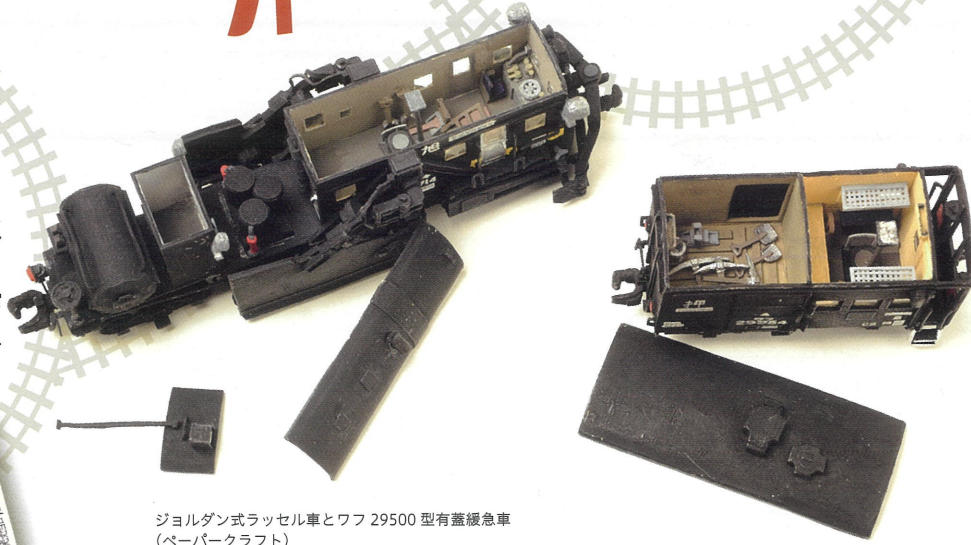
ジョルダン式ラッセル車とワフ 29500 型有蓋貨車 (ペーパークラフト)

個展を開催したり様々な展覧会へ出品したり。テレビや新聞などのメディアに取り上げられたりと、ますます活動の場を広げていく福島さん。そんな福島さんが描き出す鉄道画の世界に、ぜひ足を踏み入れてみてください。