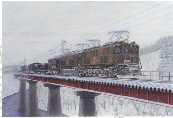
E F 重連 上越線

4歳頃から鉄道に興味を持ち、絵を描き始め、今では障害を抱えながらも努力の積み重ねにより、写真のように細密な絵を描きます。車両はもちろん、線路や架線、信号機や周辺の風景まで、本当に細かく描写されています。