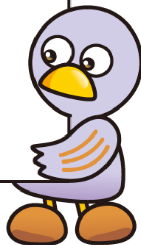
埼玉県マスコット 「さいたまっち&コバトン」