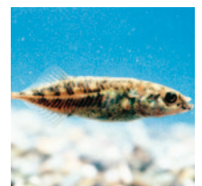
県の魚「ムサシトミヨ」