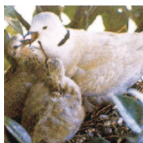
県民の鳥「シラコバト」