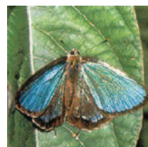
県の蝶「ミドリシジミ」