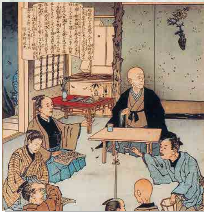
(写真) 小林清親「塙保己一『源氏物語』講義の図」

多くの有名な学者を輩出した和学講談所は、保己一が亡くなった後その子孫に引き継がれ、江戸幕府が崩壊するまでの約75年間続きました。