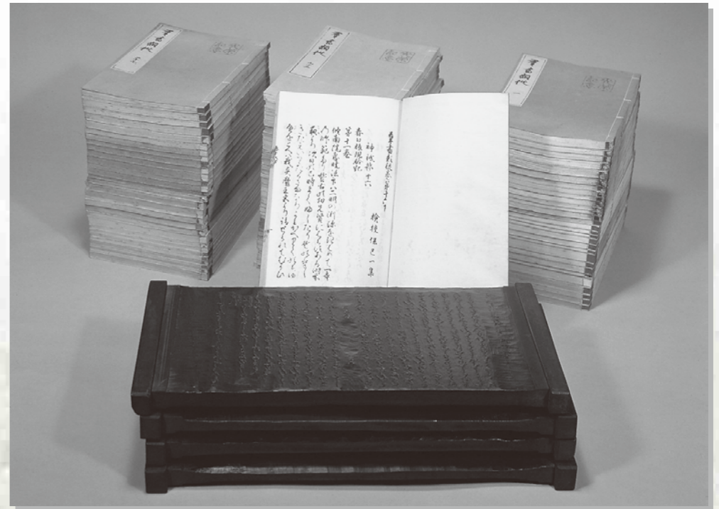
ぐんしょるいじゅう (写真) 「群書類従」と版木

保己一は、貴重な記録・文学作品等の古典籍が広く活用されることなく各所に放置され散逸していく実態を嘆き、安永8年（1779）に、そうした書物の収集と大叢書の刊行を決意しました。