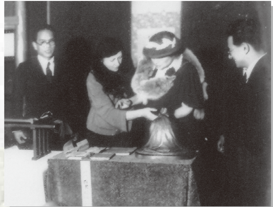
(写真) 塙保己一のブロンズ像に手を触れるヘレン・ケラー

保己一が亡くなってから115年後の昭和12年(1937)4月、米国大統領の平和親書を携えたヘレン・ケラーがはじめて日本を訪れました。