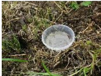
歩き回っている虫を落とし穴で捕まえる