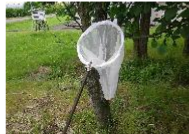
下草を掃くようにして虫を捕まえる