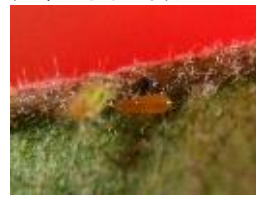
ヒメハナカメムシ