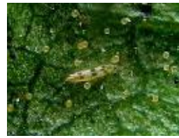
ハダニアザミウマ