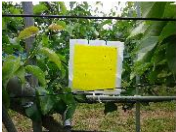
飛んでいる虫を粘着板で捕まえる