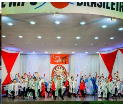
日本祭りでのよさこいソーラン