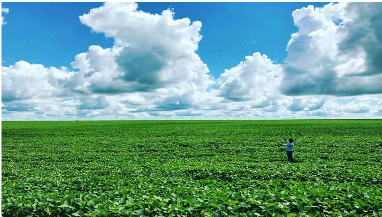
地平線が一望できる大豆畑。ドウラードスで一番好きな景色です。

観光に行きましたが、日本では中々見られない野生動物に圧倒されてしまいました。ドウラードス市はパラグアイ国境に近く、ブラジル西部に位置し、サンパウロから約 1000 キロの距離にあります。東京～長崎間をイメージして頂けると、わかりやすいかなと思います。年に 2 回サンパウロで JICA 会議が行われていて、その際はバスでの移動で約 16 時間の長旅です。自然が豊かな町で、主な農作物は大豆とトウモロコシ。ドウラードス在住の多くの日系人が農家を営んでいます。