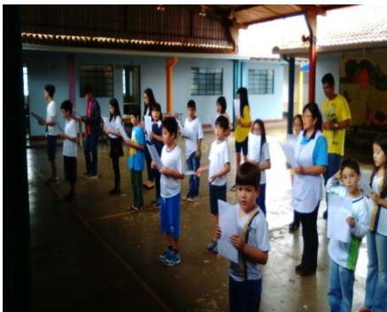
一日の始まりはみんなで歌の練習

学校名：共栄分校 開校：1971年 生徒数：7名（日系人のみ） 日系子弟の3世4世が在籍 教師数：現地教師1名+JICA ボランティア 活動日：月曜・水曜・金曜 クラス：中上級（会話）、行事補助